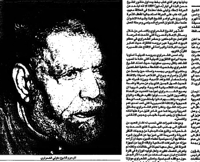
الشيخ محمد متولي الشعراوي